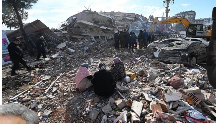
AKP lideri Cumhurbaşkanı Tayyip Erdoğan