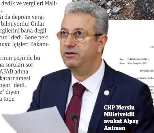
CHP Mersin Milletvekili avukat Alpay Antmen