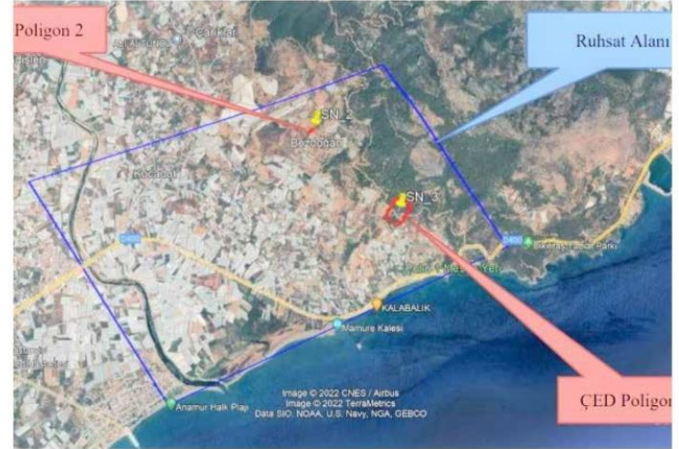
'Proje Alanı Uydı Grnts