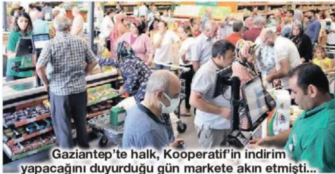
Gaziantep'te halk, Kooperatif'in indirim yapacağını duyurduğu gün markete akın etmişti...