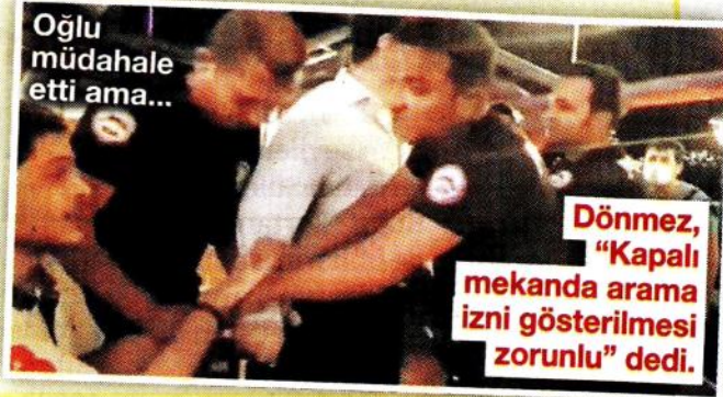
Oğlu müdahale etti ama...

Dönmez, “Kapalı mekanda arama izni gösterilmesi zorunlu” dedi.