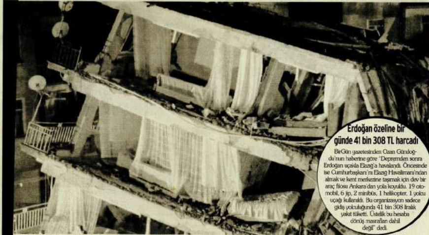
Depremde şimdye kadar 41 kişi yaşamını yitirdi, bin 607 kişi ise yaralandı, 76 bina yıkıldı. Yurttaşlar, eksi 20 derece soğukta yaşam mücadelesi veriyor.