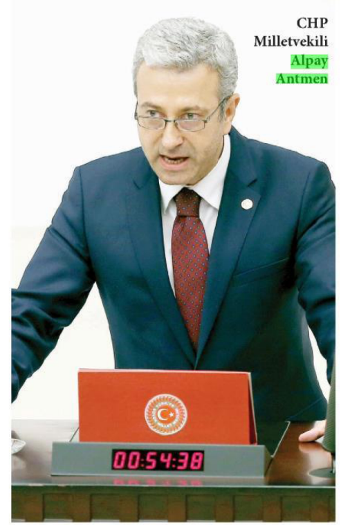
CHP Milletvekili Alpay Antmen