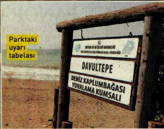
Parktaki uyarı tabelası

önergesinde, konserlerin yapılacağı alanda tam da aynı tarihler Caretta Caretta kaplumbağalarının üremek için bölgeye yumurta bıraktığı günler olduğunu belirterek "Bu doğa katliamına dur diyecek misiniz?" diye sordu. (DHA)