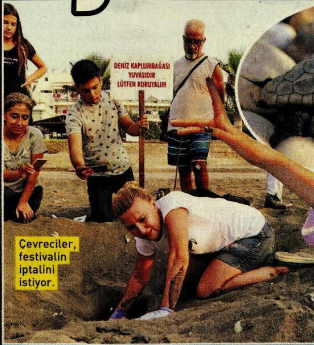
Çevreciler, festivalin iptalini istiyor.